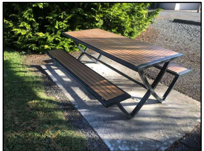
Installation de deux tables avec bancs à proximité du terrain de pétanque