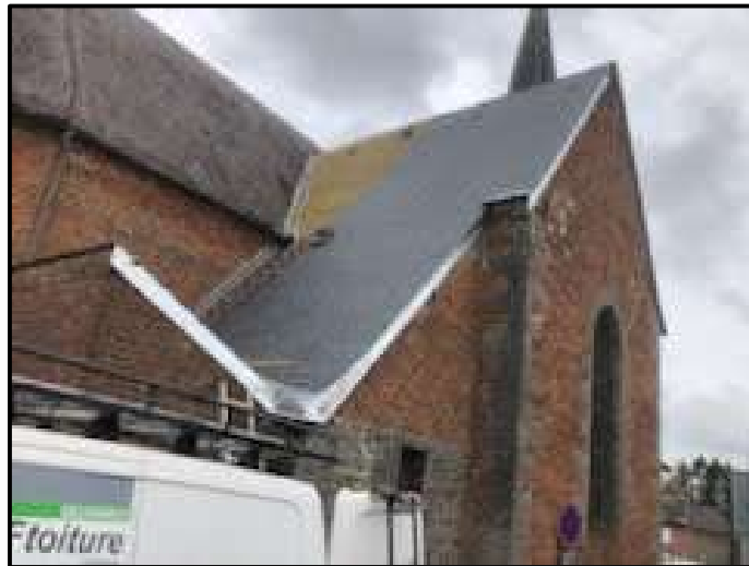
Réfection d'une partie du toit de l'église Ets MF Toiture d'Avesnelles