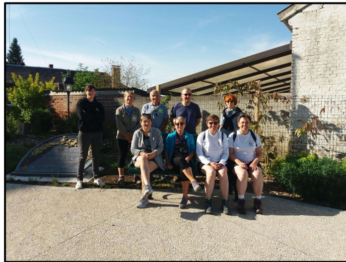
Randonnée pédestre sur les chemins de notre village