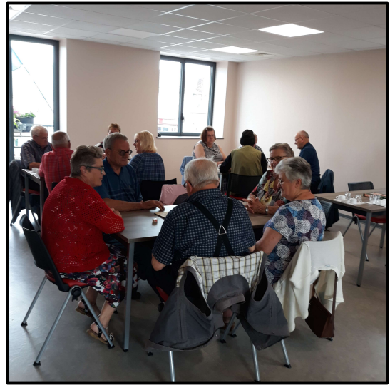
Concours de manille Espace Mireille Chatelain