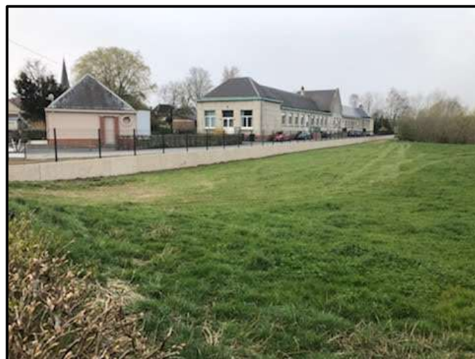
Réfection totale du mur d'enceinte de l'école côté rivière Ets Gabriel Dupas de Dompierre-sur-Helpe