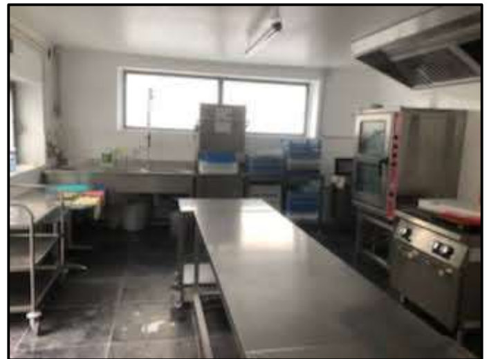
Réfection de la cuisine de la Salle des fêtes Ets Laloux de Doulers – Ateliers d'insertion 3CA – Employés communaux