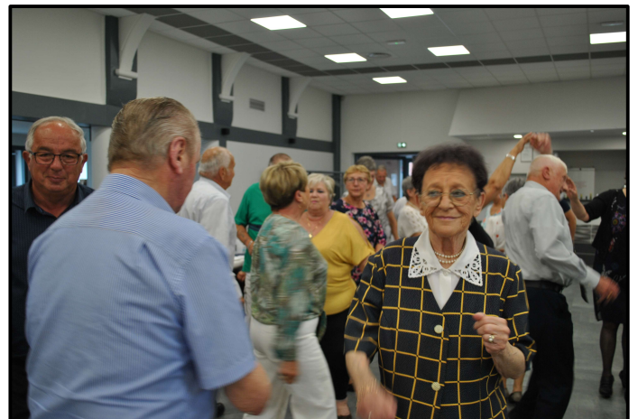
Repas des Aînés offert par le C.C.A.S.