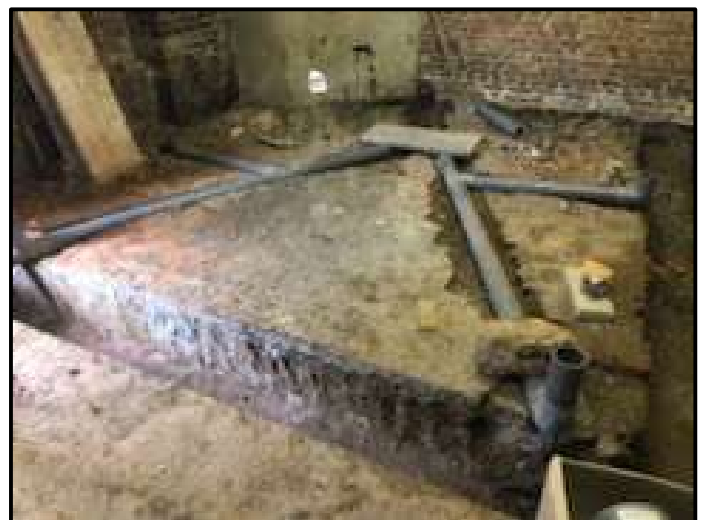
Préparation des évacuations aux futures toilettes publiques