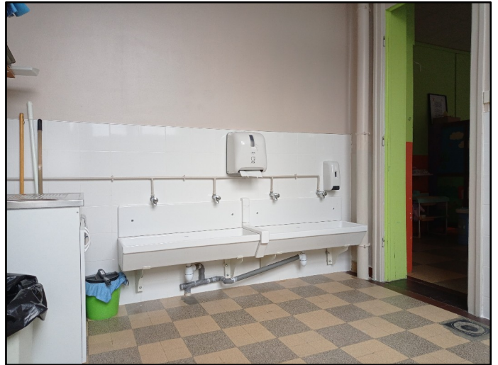
Rénovation des WC de la classe de M. Caudron à l'école