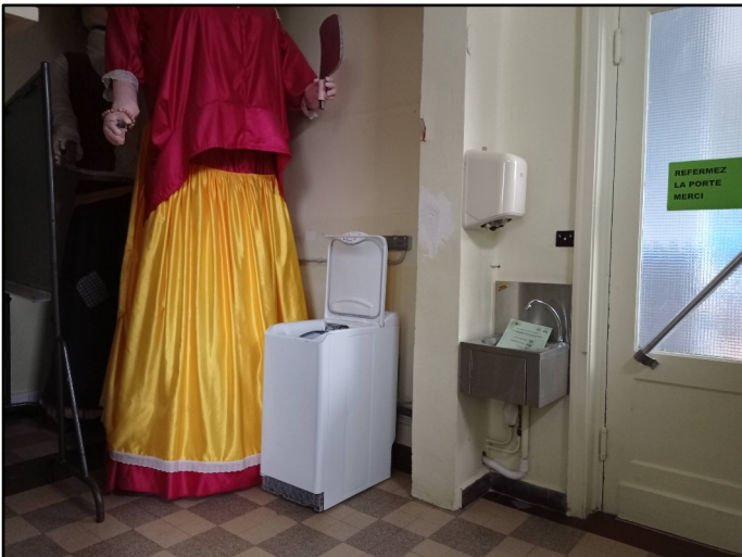
Installation d'une machine à laver à l'école