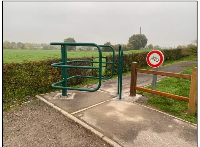
Mise en place d'une barrière sélective au Plateau Multisports